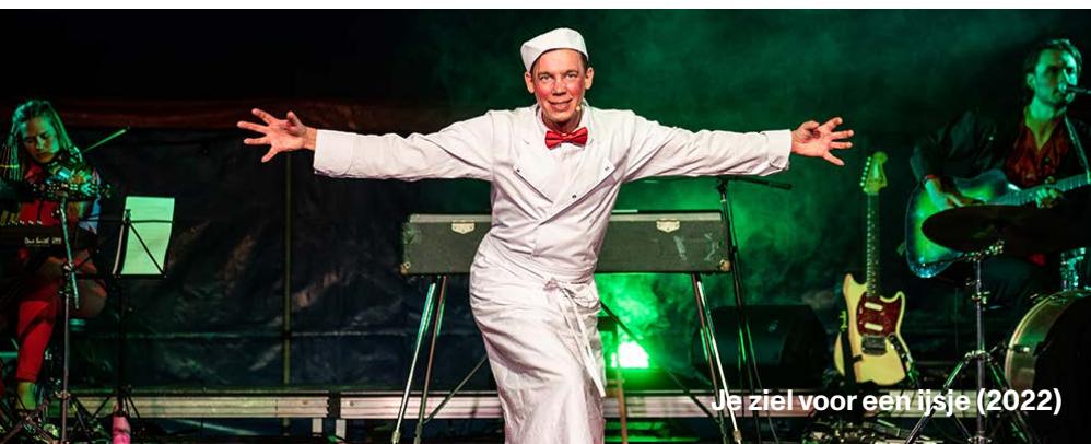
Je ziel voor een ijsje (2022)

De jaarthema's motiveren ons om ons ergens in vast te bijten, te peuteren totdat de façade loslaat en nieuwe werk- en presentatievormen te verkennen. We zijn ervan overtuigd dat we hiermee ook andere makers inspireren en de podiumkunsten in het algemeen opporren.