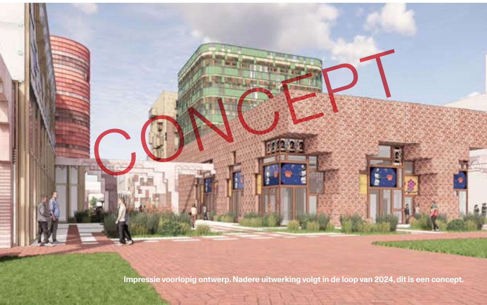
Impressie voorlopig ontwerp. Nadere uitwerking volgt in de loop van 2024, dit is een concept.