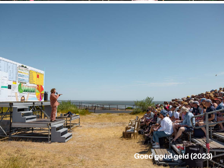
Goed goud geld (2023)