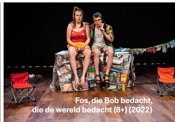
Fos, die Bob bedacht, die de wereld bedacht (8+) (2022)